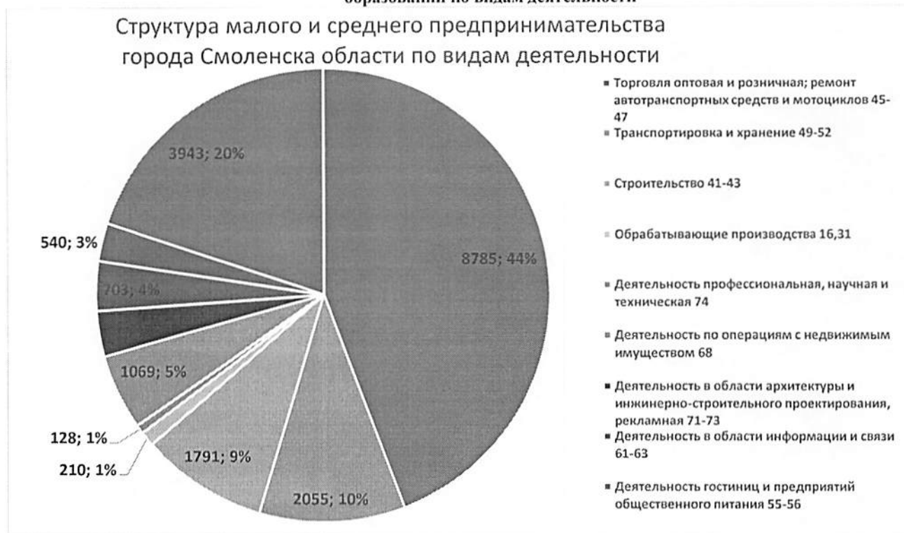
График 2. Структура малого и среднего предпринимательства в муниципальном образовании по видам деятельности

За прошедший календарный год (с июля 2023 г. по июль 2024 г.) существенных изменений в структуре малого и среднего предпринимательства по видам деятельности не произошло.