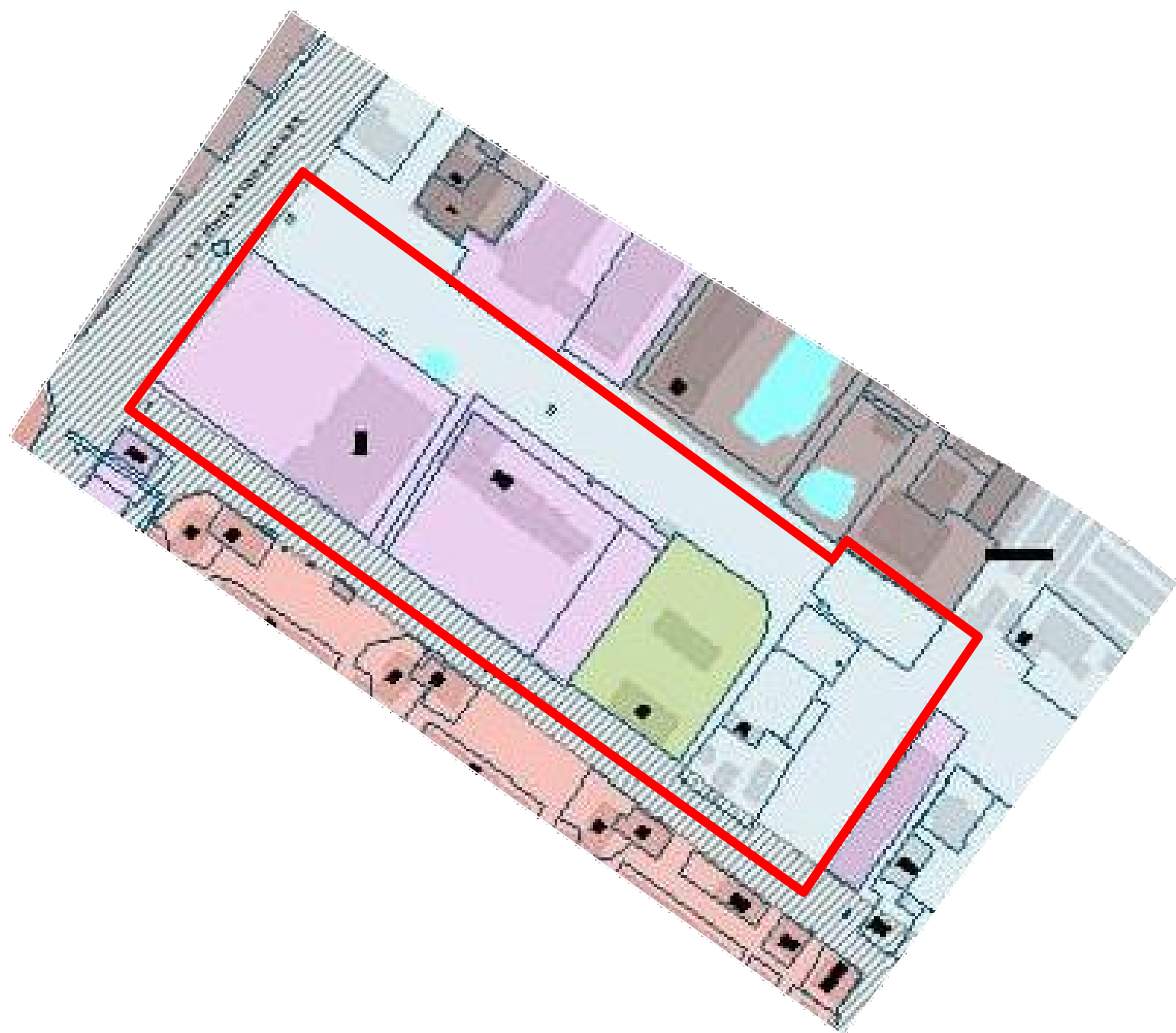
Фрагмент Карты градостроительного зонирования. Границы территориальных зон Правил землепользования и застройки города Смоленска