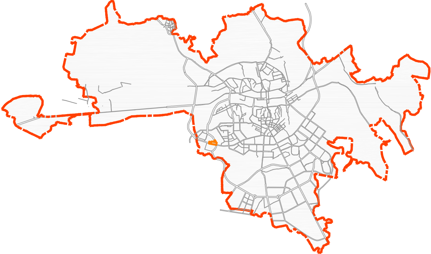
Схема расположения элементов планировочной структуры Схема размещения проектируемой территории в структуре поселения