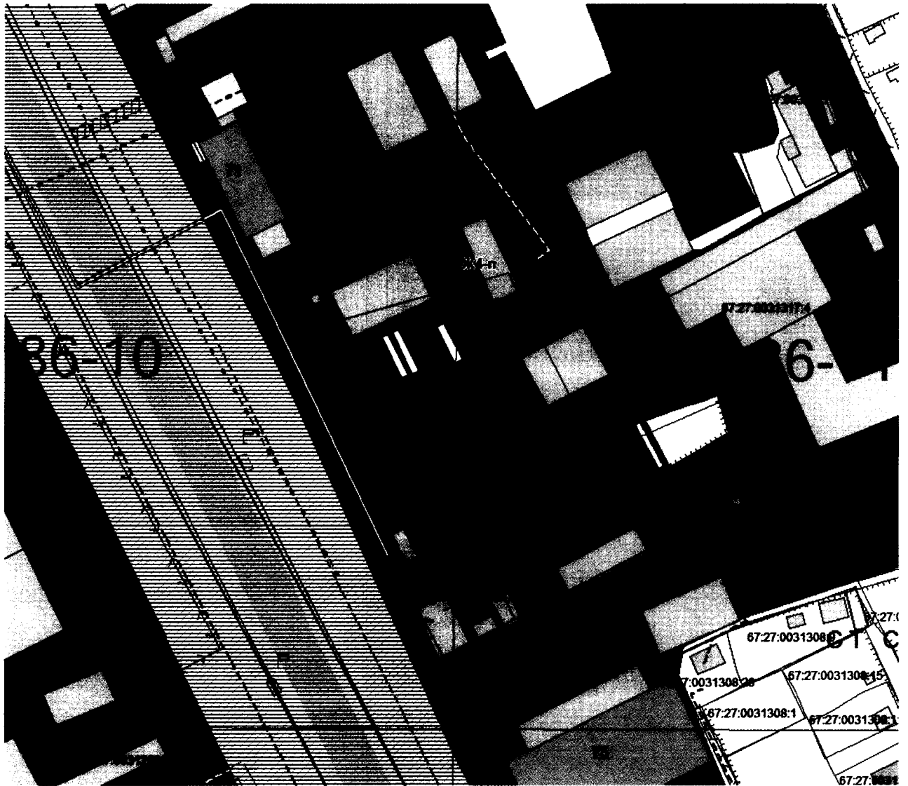
Схема расположения земельного участка с кадастровым номером 67:27:0031317:193 по адресу (иное описание местоположения): Российская Федерация, Смоленская область, город Смоленск, Рославльское шоссе, 5 км