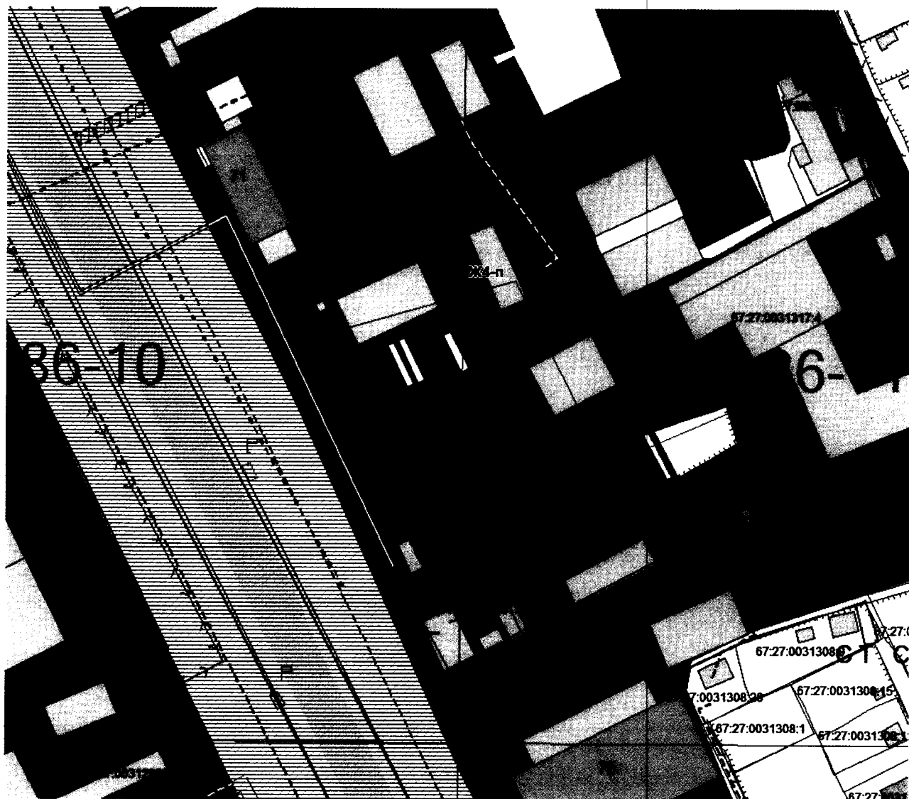
Схема расположения земельного участка с кадастровым номером 67:27:0031317:193 по адресу (иное описание местоположения): Российская Федерация, Смоленская область, город Смоленск, Рославльское шоссе, 5 км