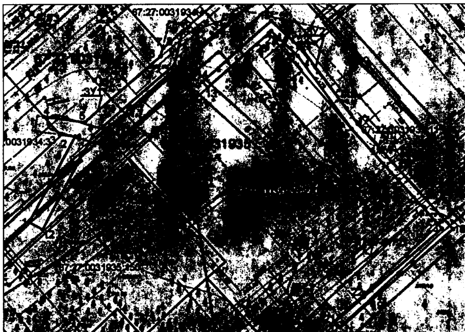
Каталог координат характерных точек границ территории МСК - 67