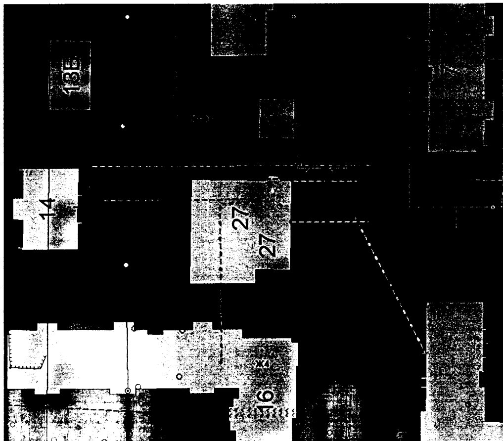
Схема расположения земельного участка с кадастровым номером 67:27:0020828:881 по адресу: Российская Федерация, Смоленская область, город Смоленск, улица Матросова, дом 27