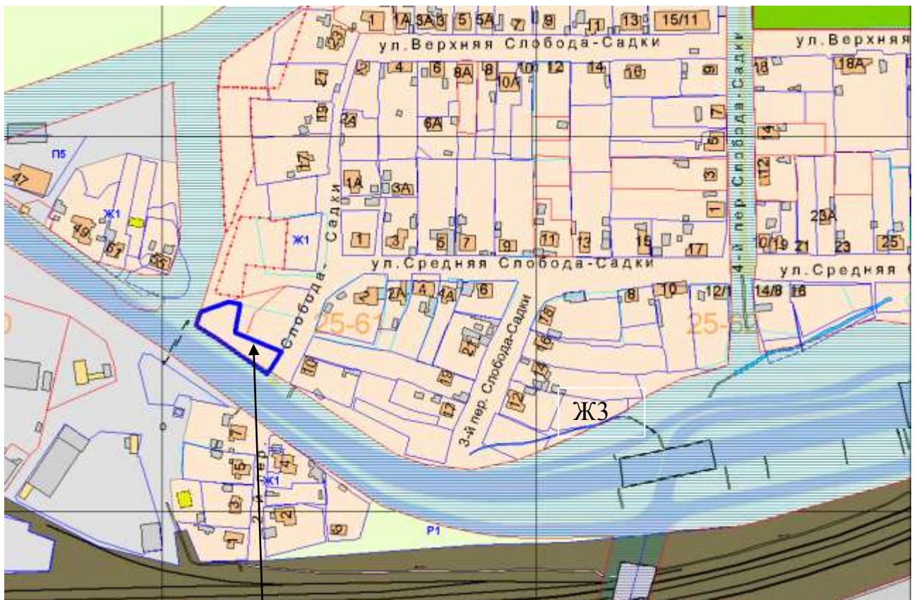
Схема расположения земельного участка по 2-му переулку Слобода-Садки