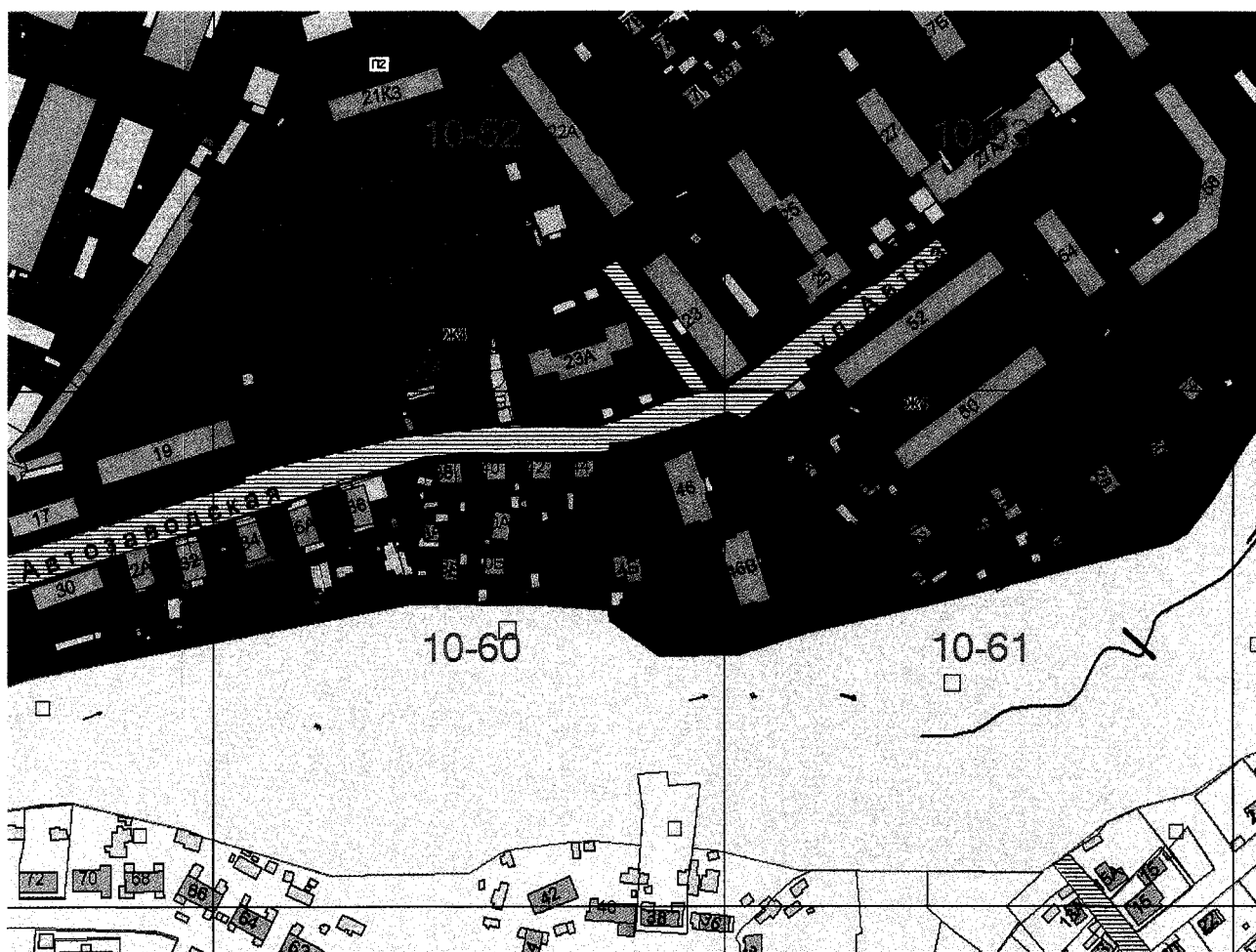
Схема расположения земельного участка в поселке Щеткино, 8

Приложение к постановлению Администрации города Смоленска от 10.12.2013 № 2195-арч